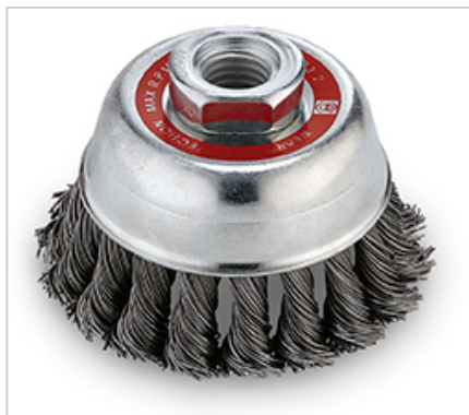
copánkový, upnutí M 14