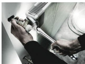
Joker 6004: Automatické a plynule samonastavitelný