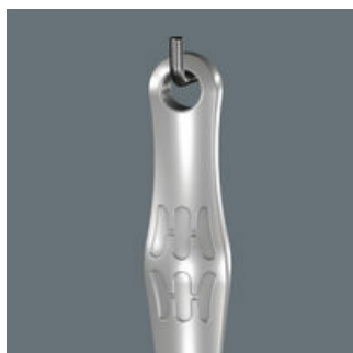
Joker 6004: Praktická závěsné očko

Díky závěsnému očku lze klíč Joker řádně uložit na stěnu v dílně.