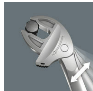
Joker 6004: Ráčnová mechanika pro rychlé "šroubování" nebo "utahování"

Funkce ráčny zajišťuje rychlé a plynulé utahování bez sejmutí klíče.